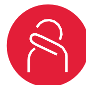
Host/nys i ærmet