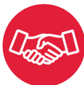
Undgå fysisk kontakt