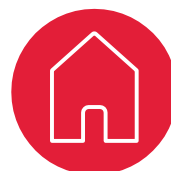
Syg? -bliv hjemme