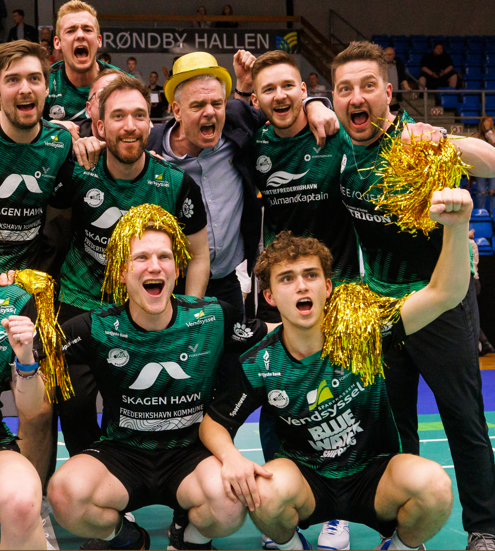
FINAL 4 Brøndby Hallen